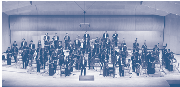
管弦楽：群馬交響楽団

【演奏曲目】スペイン奇想曲(リムスキー=コルサコフ)、ヴァイオリン協奏曲ホ短調 (メンデルスゾーン) 瞑想曲(グラスノフ)、町の思い出/旅立ち(古澤巖) ほか