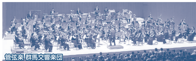
管弦楽 群馬交響楽団